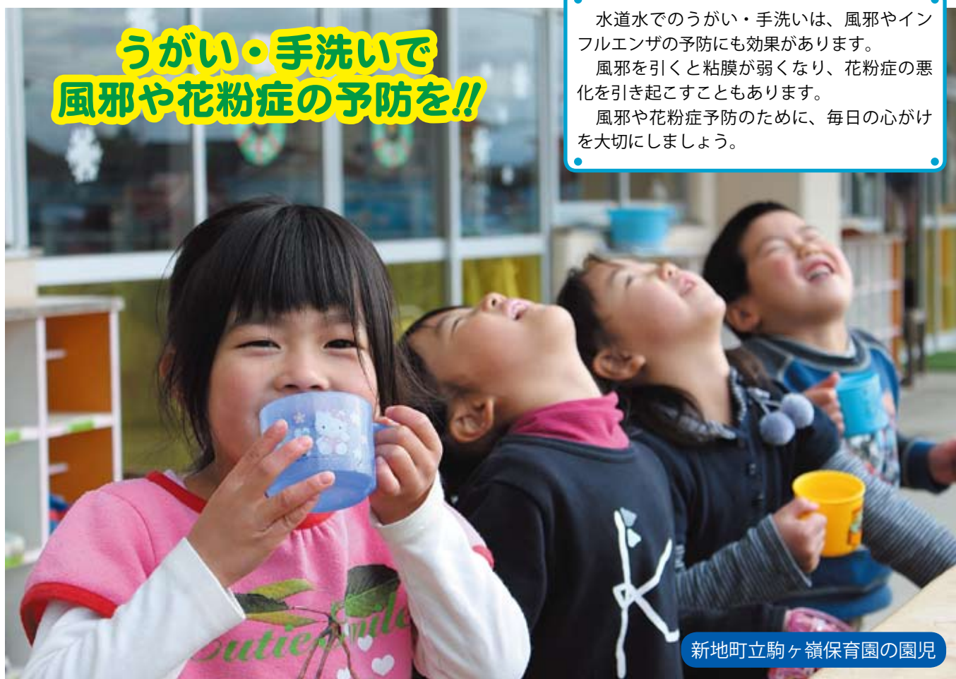
新地町立駒ヶ嶺保育園の園児