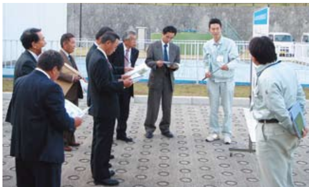
山梨県峡東地域広域水道企業団視察模様

平成21年10月13日から15日までの3日間、視察研修を行いました。山梨県の峡東地域広域水道企業団、長野県の上伊那広域水道企業団及び埼玉県の越谷・松伏水道企業団へ出向き、災害時の対応と経費の節減などに関する内容を研修しました。