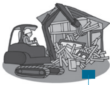
メーターボックス

水道メーターは、水道企業団がお客様にお貸ししているものであり、管理はお客様に行ってくださいになっております。家屋の解体工事、改築工事等で水道メーターを破損、紛失された場合にはお客様に弁償していただくこととなりますので、適切な管理をお願いいたします。