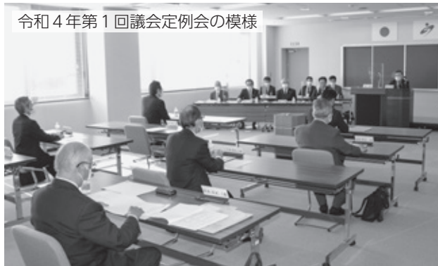
令和4年第1回議会定例会の様相