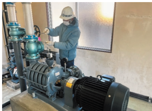
▲鴻ノ巣浄水場更新工事 (新地町)