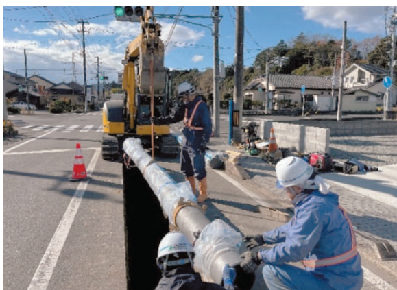
▲川原町地区配水管布設替工事 (相馬市)

令和8年度も水道施設の整備および更新工事を予定しております。工事中の安全確保と、みなさまの生活への影響が最小限となるよう努めてまいりますので、ご理解とご協力をお願いいたします。