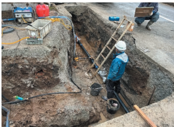
▲岡和田地区配水管布設替工事 (南相馬市鹿島区)